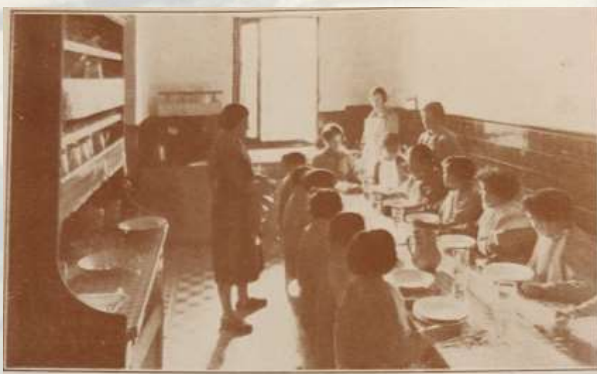
Cantina escolar de Izarza (Sondika). Extractada del libro de Zufía, Pedro; Las escuelas de barriada en Vizcaya, 1930.

Así, en el año 1932 la maestra Soledad Gorriño, solicita la instalación de la Cantina (1) en el centro escolar.